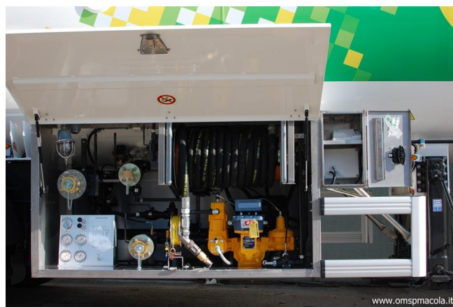
Vehículo cisterna para el transporte de gas.