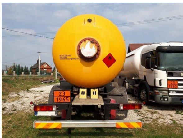
Transporte de butano.

1.3.2.4 La formación debe ser completada periódicamente mediante cursos de reciclaje para tener en cuenta los cambios en la reglamentación.